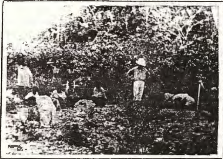
NHỮNG NGÀY CUỐI CÙNG CỦA ÔNG VINH Ở BÊN LẠO CUỐI THÁNG 4 - 1936