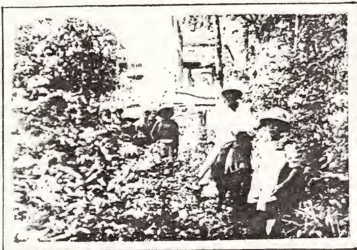
NHỮNG NGÀY CÚI CUNG CỦA ĐỒNG NÔNG-V-VĨNH TRONG RỪNG TRƯỜNG SƠN Ở BẾN LÃO.