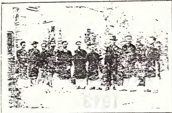
QUÂN VIÊN NHÀ IN TRUNG BẮC TÂN VĂN 61-63 HÀNG BÔNG HÀ NỘI ẢNH CHỤP 1917