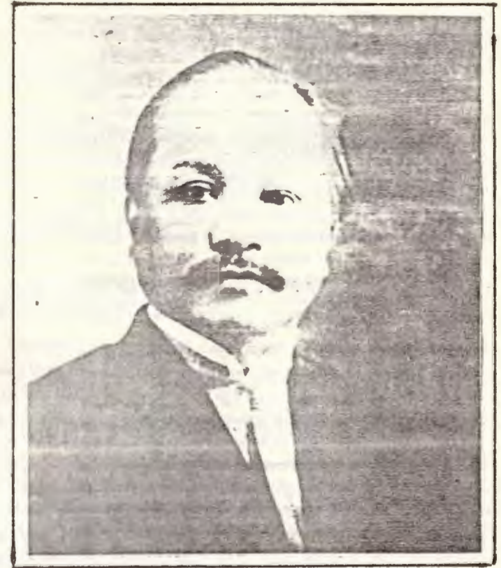
NGƯỜI ĐÃ CÙNG ÔNG PHAN CHÂU TRINH Ở PARIS GIÚP ĐỠ NGUYỄN TẤT THÀNH TRỞ THÀNH NGUYỄN ÁI QUỐC.