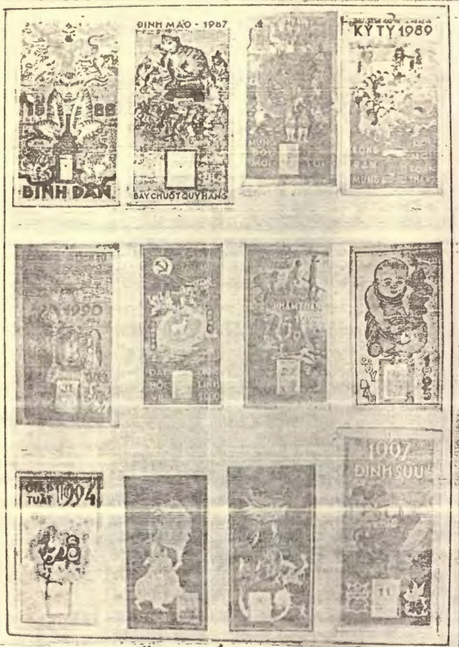
15 NĂM CƯỜI THẾ KỶ XX