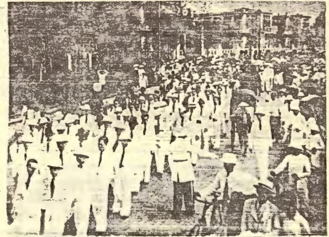
Đám tang ông Nguyễn Văn Vĩnh 8-5-1936 - Đoàn nhà báo mặc âu phục

- Nguyễn Tất Thành (1890-1969) một thanh niên trẻ đầy nhiệt huyết, ham học hỏi, sẵn sàng tiếp nhận và học hỏi kinh nghiệm để trưởng thành về sau trở thành Nguyễn Ái Quốc rồi Hồ Chí Minh.