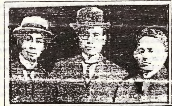
PHẠM DUY TÂN PHẠM QUỲNH NGUYỄN VĂN VĨNH DỰ ĐẦU XÃO THUỘC ĐỊA MARSÉILLE 1922